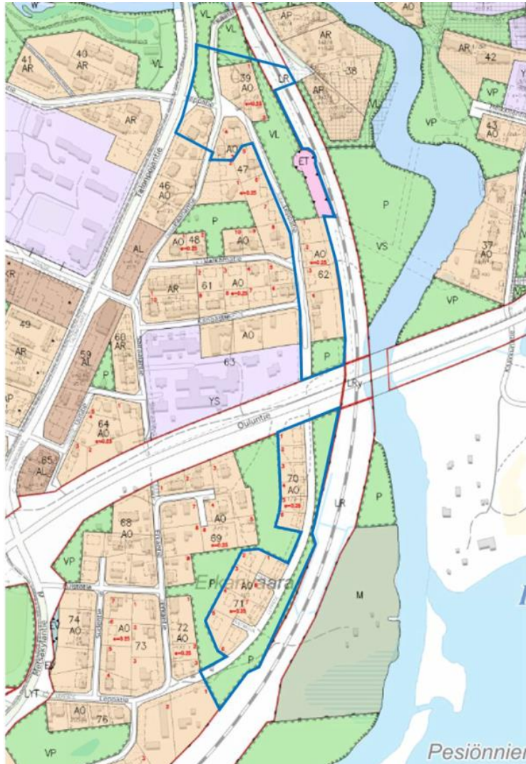
Ote voimassa olevasta asemakaavayhdistelmästä ja kaavamutosalueen alustava raja-alue sinisellä.