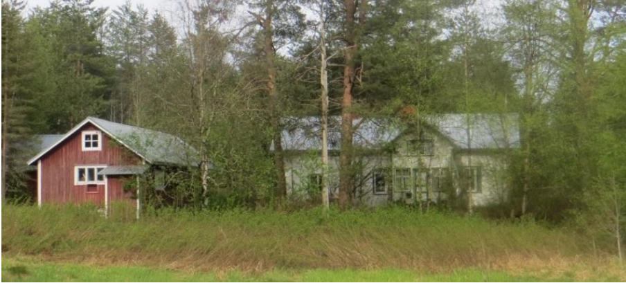
110. Lamminrinne, rakennettu 1947. (RaHu-rekisteri). Talo on tyhjillään ja pihapiiri on kasvanut lähes umpeen.