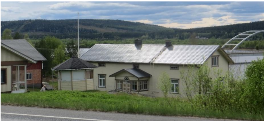
102. Heikka. Rakennuksen pirtti -ja keittiöosa ovat 1800-luvulta, ja tupapää on 1900-luvun alussa rakennettu. 1940–50-lukujen vaihteessa korotettu kaksi hirsikertaa ja ylös rakennettu huoneita, 1950-luvulla pikkukamari ja vuosina 1959–64 isompi kamari. Nykyinen omistaja on ostanut kohteen perinnön jaosta. Pihassa, nykyisen asuinrakennuksen paikalla on ollut ennen kesätupa, mutta se on purettu. Vanha navetta on purettu 1900-luvun alkupuolella. (Lähde: LKYT-tietokanta)