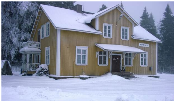
58. Aavasaksan asema