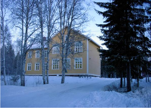
79. Tengeliön koulu