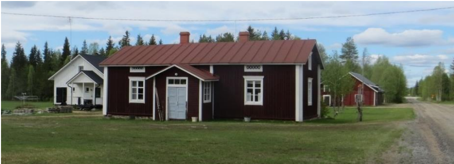
101. Alajaako. Päärakennus on siirretty nykyiselle paikalle Pellostä Yrttiahon törmältä v.1862. Tila on toiminut karjatilana, mutta lopettanut karjanpidon 1980-luvulla.