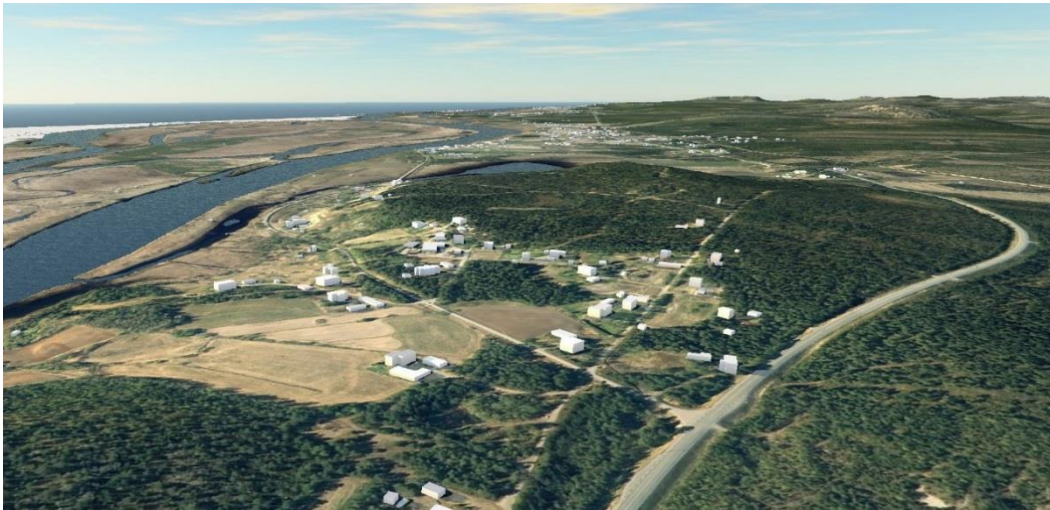
Ote maastomallista. Hietaniemi-Kainuunkylä on asutettu vähintään 1000 vuotta sitten.

Tornionjokivarren maisemaa hallitseva Aavasaksa on määritelty yhdeksi Suomen kansallismaisemista. Aavasaksa oli yksi Suomen ensimmäisistä matkailukohteista, joka tunnettiin jo 1800-luvulla.