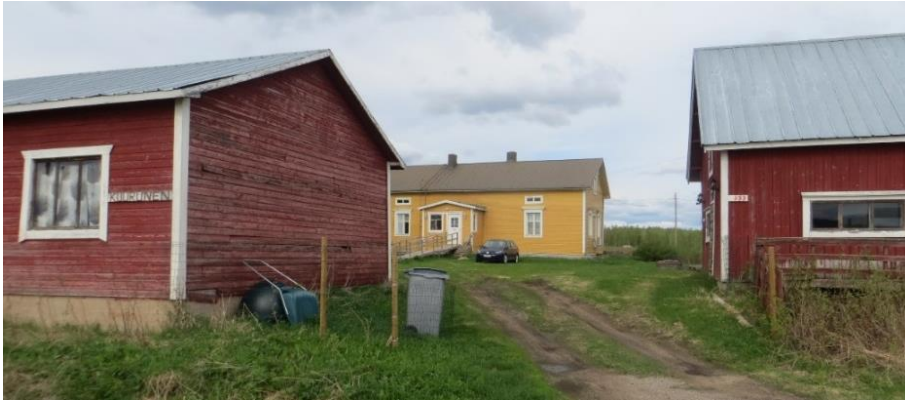
108. Kuurunen. Päärakennus on valmistunut v.1864. Navettarakennus on vuodelta 1955. Tilan vanha leipomatupa on purettu 1950-luvulla. Liiterirakennus on valmistunut 1952.