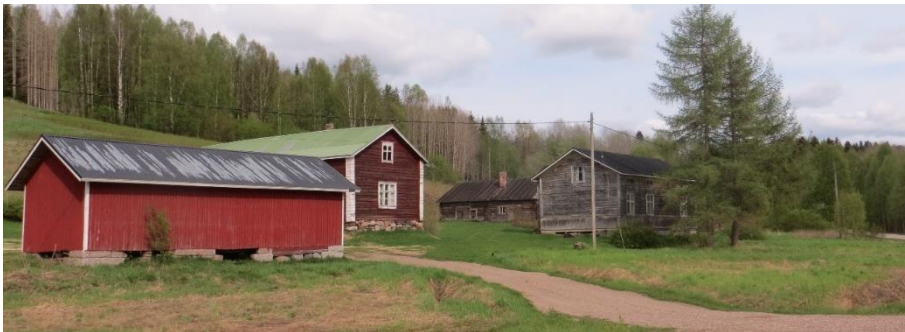
16. Alalauri (Poikkilahti) ja 17. Lauri