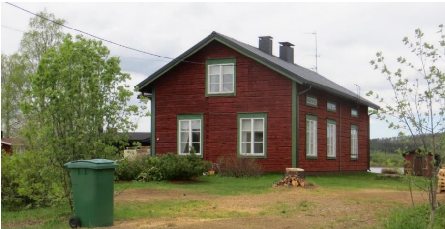
109. Tapiola. Talo on alun perin rakennettu vuonna 1915, mutta siirretty nykyiselle paikalle Rantakylään vuonna 1978.