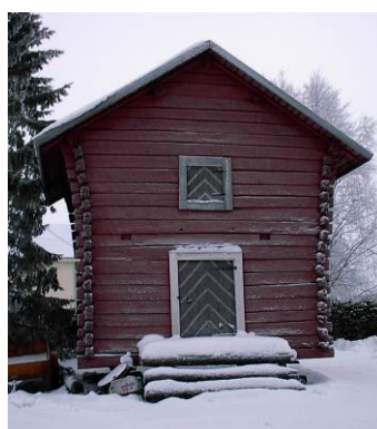
62. Juholan aitta

V.1916 rakennetussa aitassa on ylöspäin levenevät seinät ja ovissa puuhun veistetyt kalanruotokuviot.