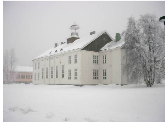
44. Päivärinta (kristillinen kansanopisto)

Rakennuksessa on havaittavissa kirkkoarkkitehtuurin piirteitä. Rakennus toimi aiemmin talvisin kirkkona varsinaisen kirkon ollessa talvet kylmillään.